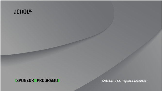
VERZE B Prima_COOL SK_sponzor_programu_B.tga