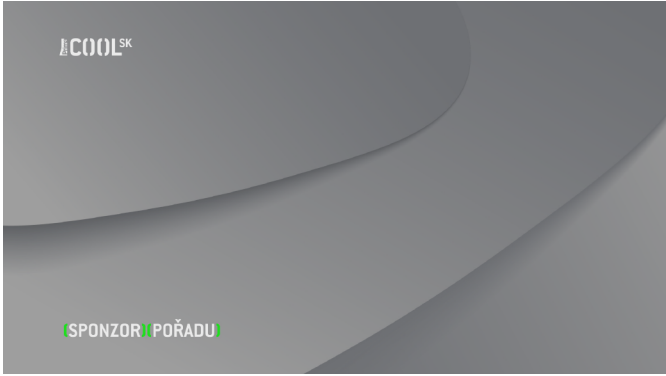
VERZE F Prima_COOL SK_sponzor_poradu_F.tga