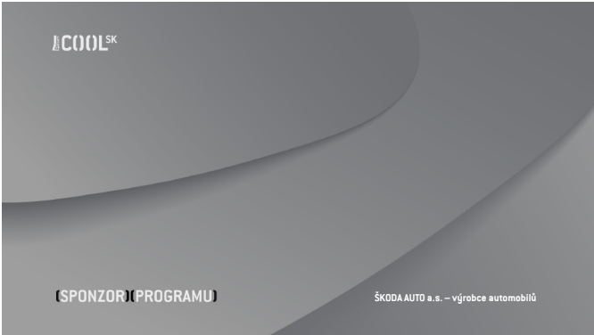
VERZE C Prima_COOL SK_sponzor_programu_C.tga