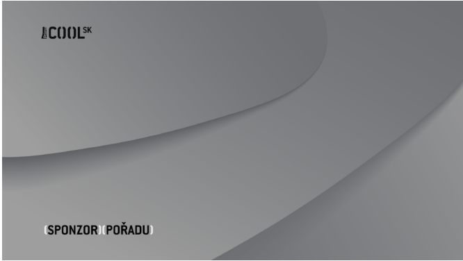
VERZE D Prima_COOL SK_sponzor_poradu_D.tga