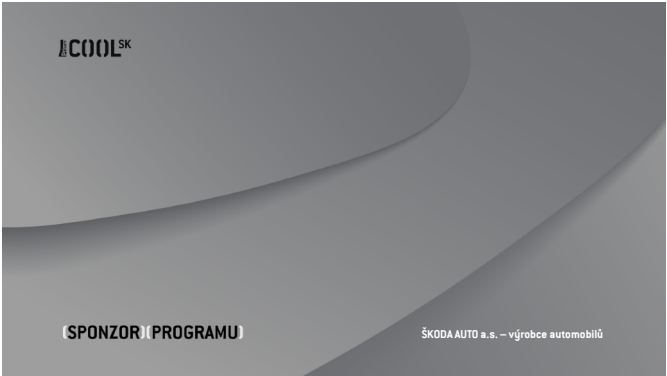
VERZE D Prima_COOL SK_sponzor_programu_D.tga