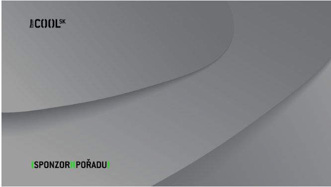
VERZE B Prima_COOL SK_sponzor_poradu_B.tga