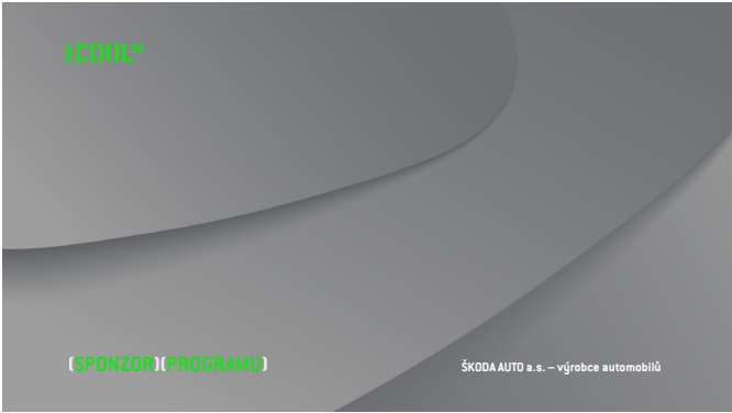
VERZE E Prima_COOL SK_sponzor_programu_E.tga