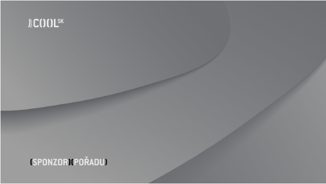
VERZE C Prima_COOL SK_sponzor_poradu_C.tga