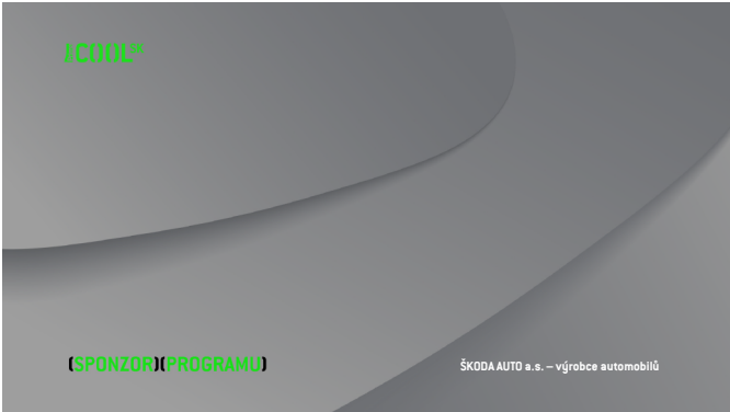
VERZE A Prima_COOL SK_sponzor_programu_A.tga